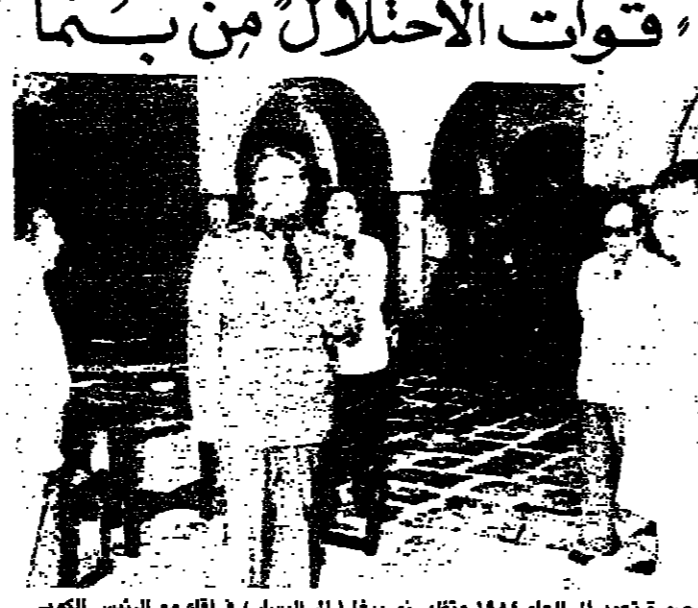
صورة تعود الى العام ١٩٨٤ وتظهر تورييغا (اليسار) في لقاء مع الرئيس الكويتي كسترو في هالفا